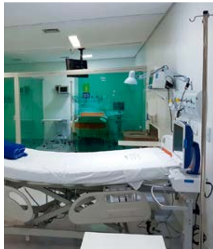
UTI conta com equipamentos modernos e equipe multiprofissional