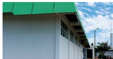
Estrutura externa foi totalmente reformada