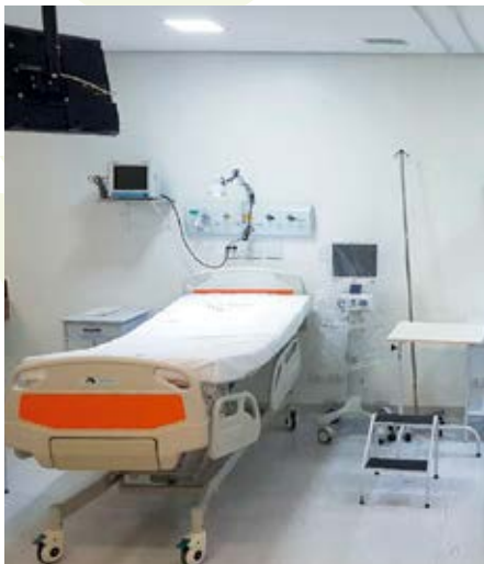
Ao todo são 10 leitos de UTI

tal, serão beneficiadas com a UTI, que permitirá o atendimento dos pacientes graves com agilidade, eficiência, diminuição da demanda de transferência para cidades maiores, como Dourados e Campo Grande, e consequentemente redução da mortalidade. O próximo passo será ampliar a capacidade da UTI para mais 10 leitos.