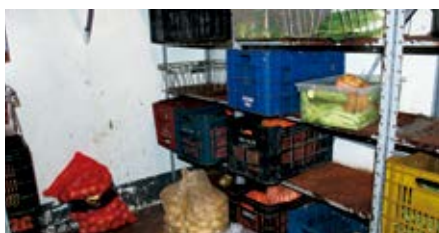
Despensa com prateleiras enferrujadas e alimentos mal armazenados