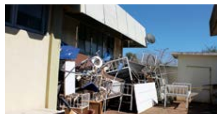
Área externa usada como depósito de entulhos