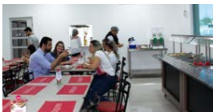
Cozinha totalmente reformada e dentro dos padrões de higiene e qualidade