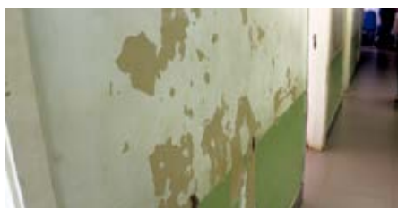
Paredes com infiltrações e descascadas nos corredores