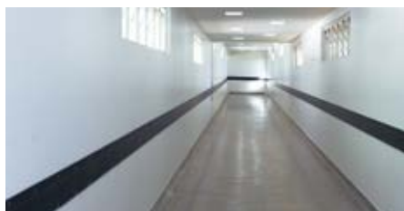
Paredes ganharam impermeabilizações e novas pinturas